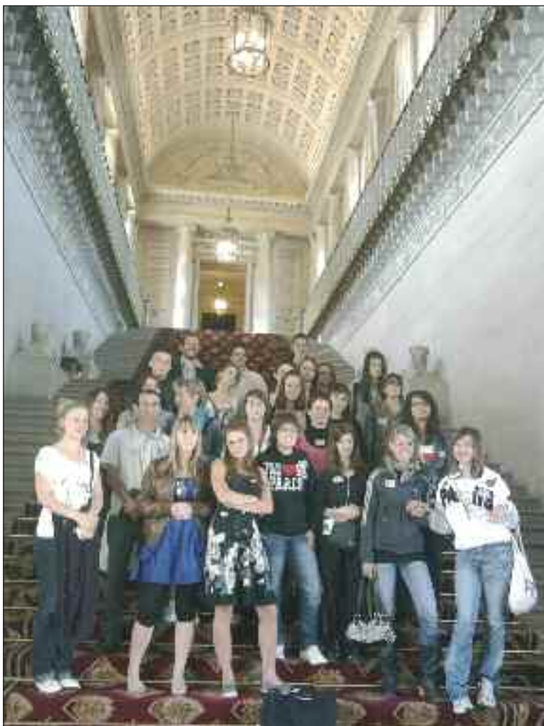
Mais c'est Versailles !

Durant la première semaine de juin, les élèves de 3 e ont pu profiter d'un séjour pédagogique à Paris.