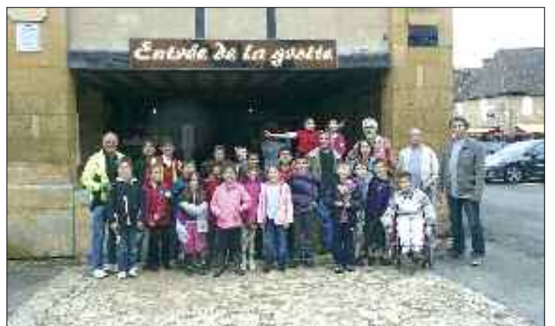
Avant la visite de la grotte de Domme

Mardi 8 juin, malgré un temps très incertain, les élèves de CE2 et de CM1 ont profité d'une éclaircie pour quitter l'école et prendre leur VTT à destination de Domme.