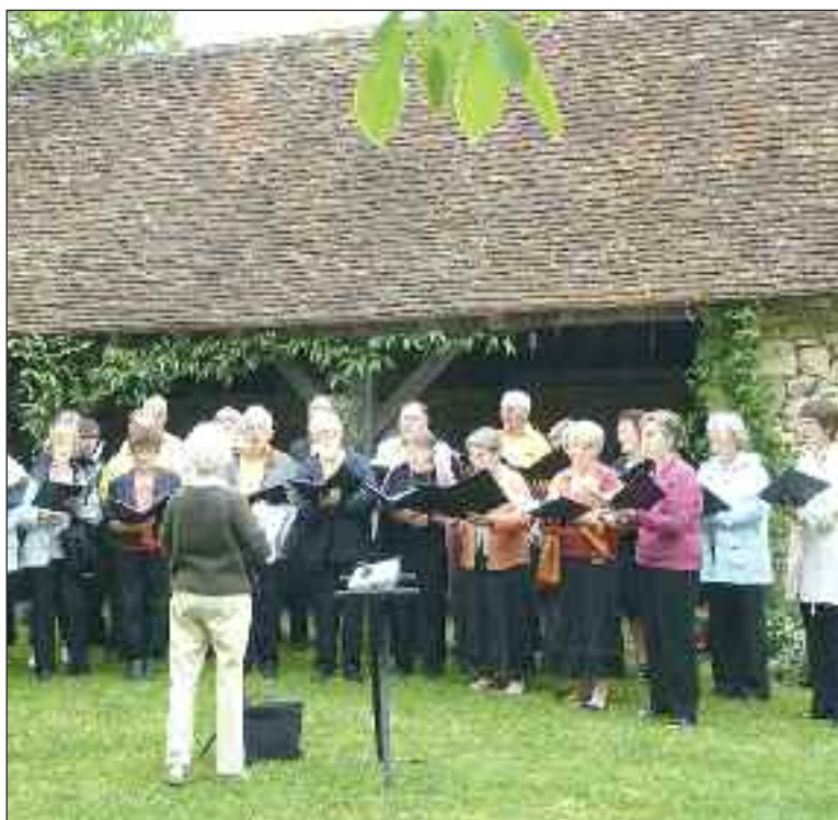
La chorale Méli-Mélocie

Des orages et des températures en baisse étaient annoncés pour le dimanche 6 juin, jour de l'opération Rendez-vous aux jardins. Météo France ne s'était pas trompée... Malgré ces conditions météorologiques défavorables, l'association Les Amis du Vieux Plazac qui organisait une balade musicale aux jardins de Chanloubet est satisfaite de son initiative. Le répertoire riche et varié de la chorale Méli-Mélocie, dirigée par Mme Despeyroux, a été très apprécié.