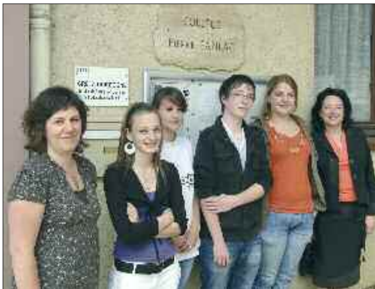
Les lauréates du concours de la Résistance