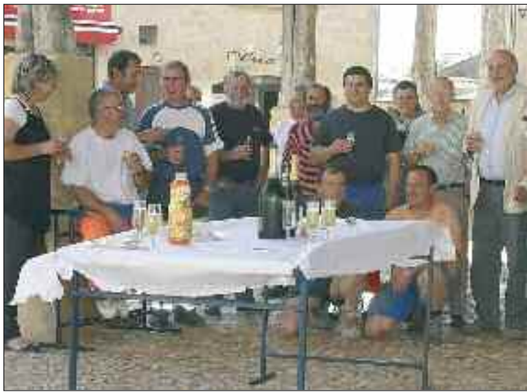
Le maire, à droite, et le personnel communal à l'honneur

Prévue initialement sur deux années, la réfection complète du pisé de la halle moyenâgeuse est terminée avant que ne débute la saison touristique.