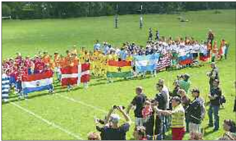
Les équipes des U13

Dernier week-end de la saison pour les U13 du FCSM qui participaient au tournoi du Lardin-Saint-Lazare organisé sur une formule Coupe du monde avec vingt-quatre équipes venues d'horizons divers : Bègles, Cublac, Salles, estuaire Haute-Gironde, Bergerac, Trélissac, Prigonieux, etc. Ces formations se sont affrontées sur deux jours. Chacune représentait un pays et arborait l'équipement et le drapeau correspondant.