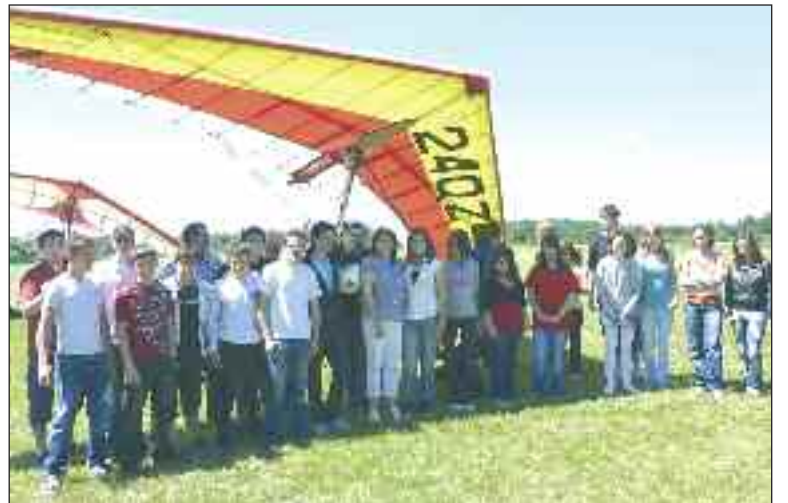
Les élèves à l'ombre d'une aile volante