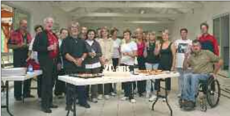
Le président, le maire et les deux animateurs entourés de quelques licenciés

Il y a vingt ans, lors d'une réunion du conseil d'administration de l'Amicale laïque, il fut décidé de créer une section gymnastique d'entretien au sein de l'association.