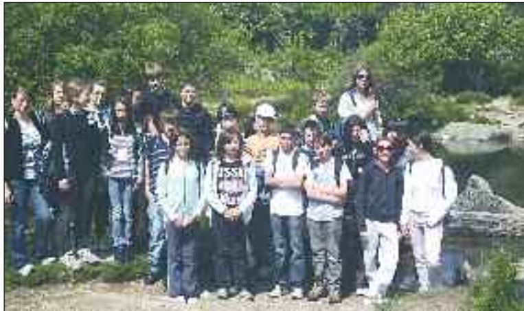
Les élèves ont arpenté le parc de Dartmoor

Les classes de 5 e E et de 6 e C du collège Pierre-Fanlac ont visité le Devon et les Cornouailles.