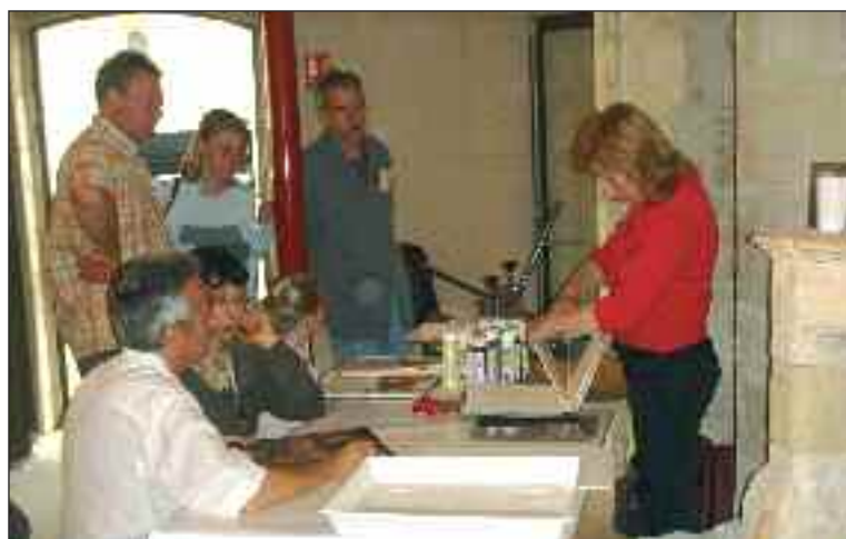
Démonstration de savoir-faire