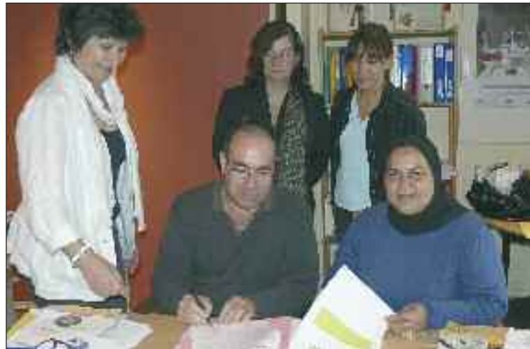
Les présidents signent la convention