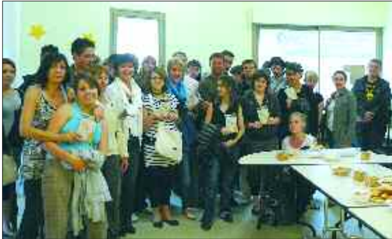
Les élèves ont reçu leur exemplaire du recueil